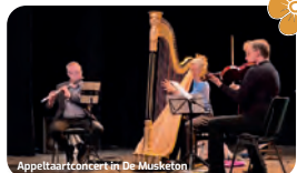
Appeltaartconcert in de Musketon