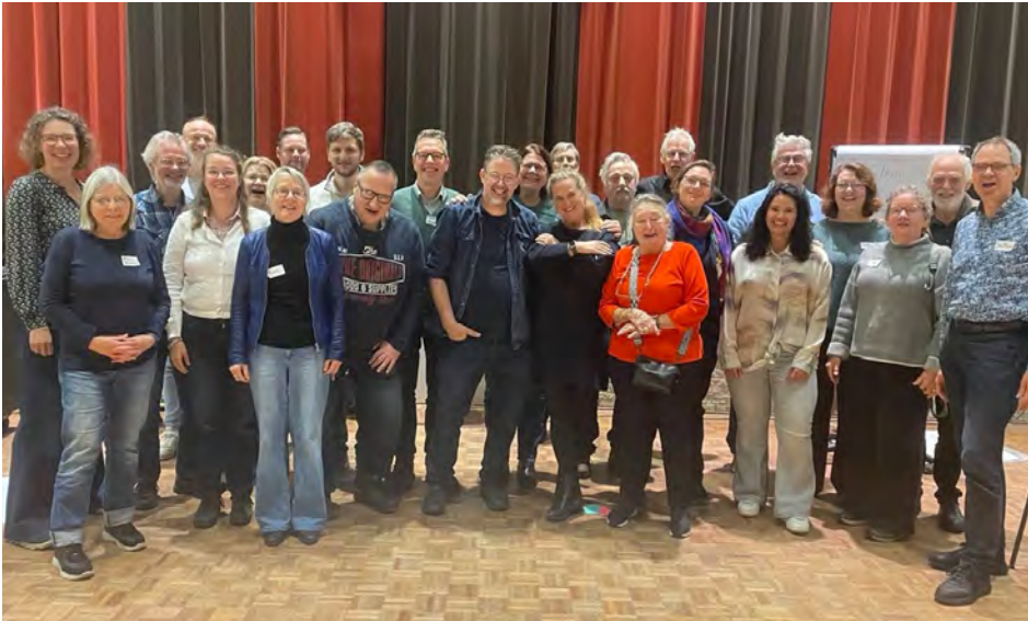
Hart voor Lunetten: samenwerken in de wijk, bijeenkomst op 30 november 2025.